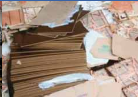
Mercancía dañada en el puerto de descarga