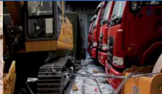
Estiba, trincaje y seguridad inapropiadas