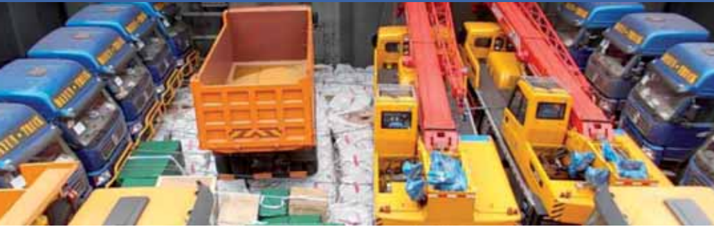
Carga general en un granelero