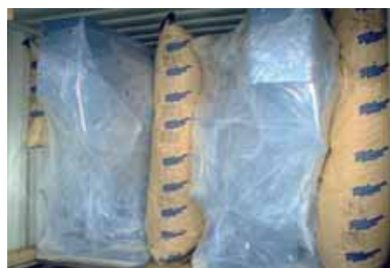
Paquetes irregulares protegidos con bolsas