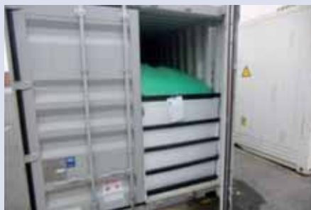
Contenedor equipado con un flexitank