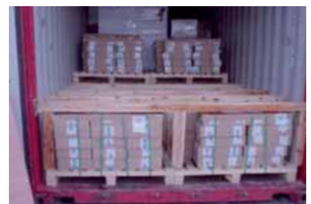
Suelo temporal de madera