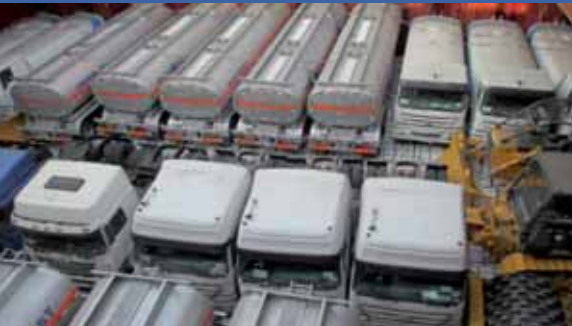
Proximidad de vehículos estibados sobre un cargamento de cemento