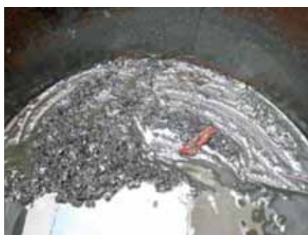
Sedimentos en el fondo del tanque