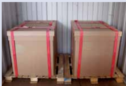
Mercancía asegurada a los pallets con trincas textiles