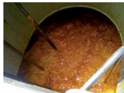
Aceite de palma crudo