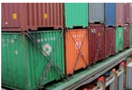
Guías y barras de trincaje en un portacontenedores

El Código consta de 13 capítulos y 10 anexos. Mucha de la información recopilada durante la preparación del Código fue considerada demasiado específica o susceptible de convertirse pronto en desfasada, por lo que no se incluyó en el Código. Esta información se ha designado como "material relacionado" y puede ser puesta al día en el futuro por sectores de la industria interesados. No se prevee que este Código sea actualizado regularmente de la misma manera que el Código IMDG.