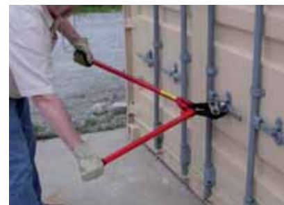
Cortando el sello